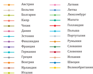
г. Рисунок – случаи заболевания раком молочной железы среди женщин на 100 000 человек (Европейский Союз – ЕС 27)

Одним из экологических факторов, который может вызывать рак молочной железы, является воздействие некоторых искусственных химических веществ. Появляются все новые подтверждения теории о том, что воздействие загрязняющих веществ в окружающей среде, пище и воде и химических веществ в товарах широкого потребления в наших домах, офисах или школах может являться фактором риска заболевания раком молочной железы 5,6,7,8 .